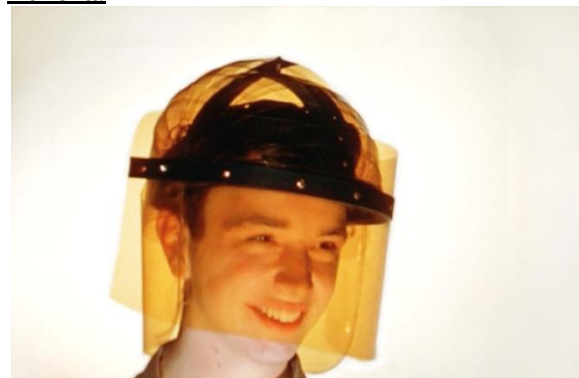
László Moholy-Nagy mit Studenten des Institute of Design, Design Workshops, 1944 (Einzelbild aus dem Film)