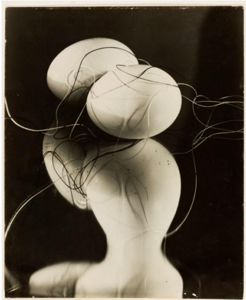
György Kepes, Ohne Titel (Eier und Faden auf Spiegel), 1942 Bauhaus-Archiv Berlin © Juliet Kepes-Stone