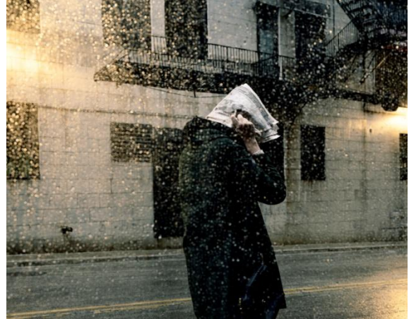
Clarissa Bonet, Caught in the Storm (aus der Serie City Space), 2011 © Clarissa Bonet courtesy Catherine Edelman Gallery, Chicago