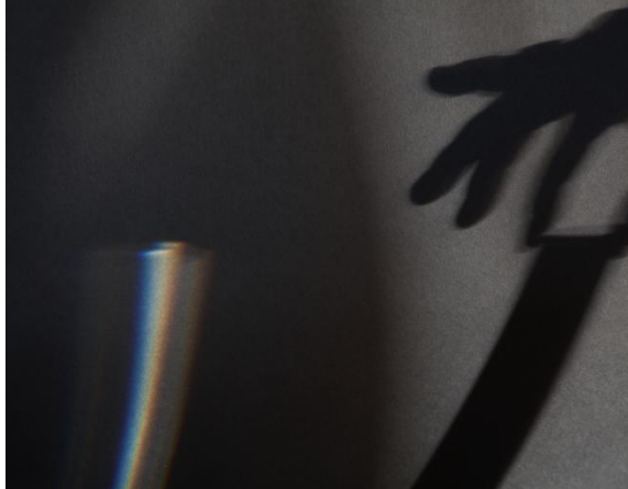
Sonja Thomsen, Opticks 123, 2015