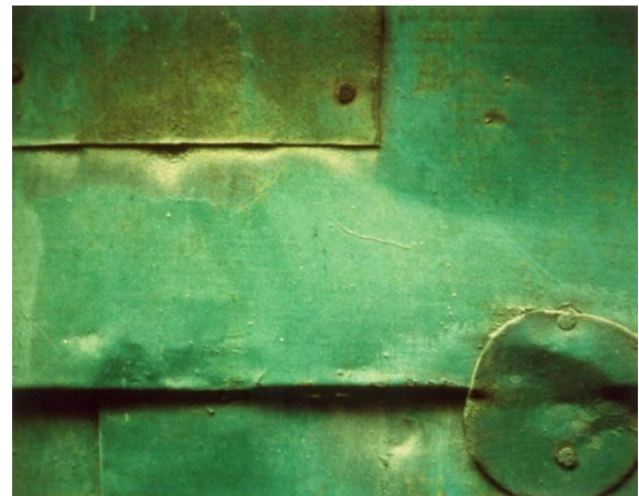
Nathan Lerner, Green Image, 1976 © Bauhaus-Archiv Berlin / VG Bild-Kunst, Bonn 2017