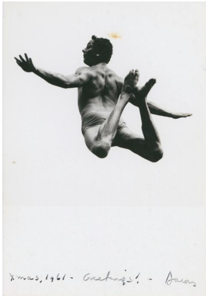
Aaron Siskind, Pleasures and Terrors of Levitation, 1961 Bauhaus-Archiv Berlin