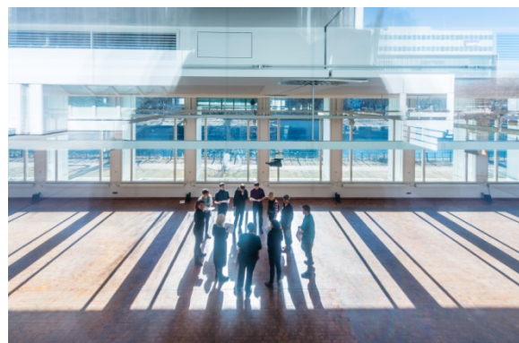
Das Bauhaus-Archiv / Museum für Gestaltung, Berlin, Innenansicht, 2018