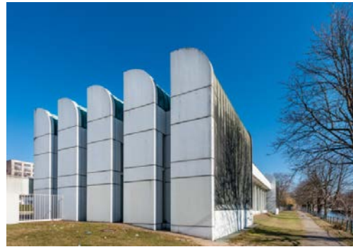
Das Bauhaus-Archiv / Museum für Gestaltung, Berlin, 2018