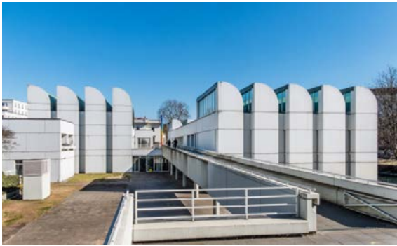
Das Bauhaus-Archiv / Museum für Gestaltung, Berlin, 2018