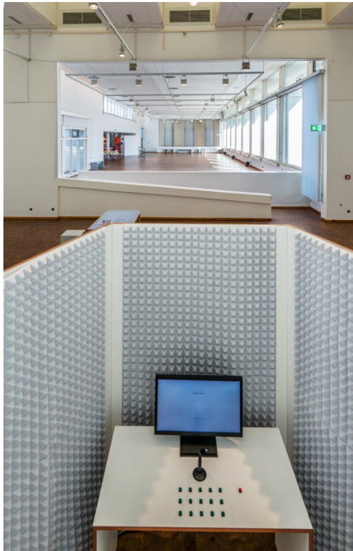
Blick aus der Aufnahmekabine des Klangkunstwerks „Totale Architektur von Janina Janke und Bill Dietz auf die Innenhallen, 2018