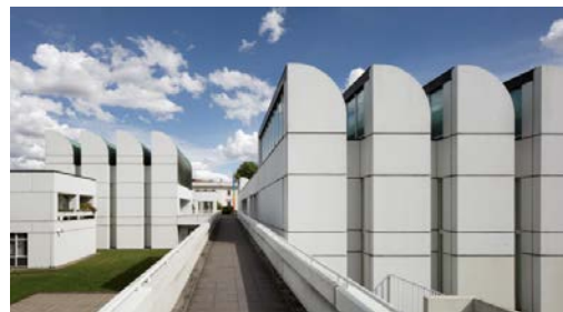
Das Bauhaus-Archiv / Museum für Gestaltung, Berlin, 2015