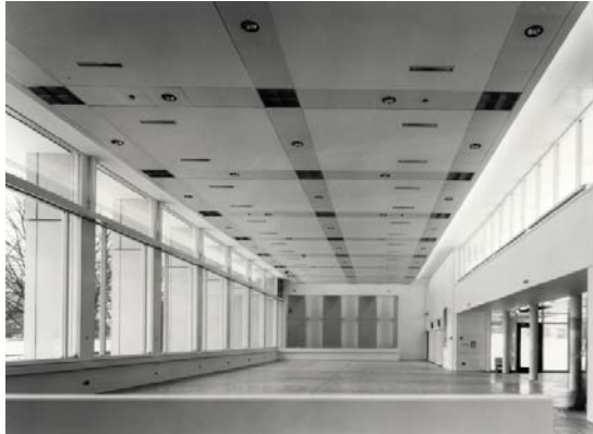
Das Bauhaus-Archiv / Museum für Gestaltung, Berlin, Innenansicht, 1979