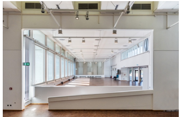
Das Bauhaus-Archiv / Museum für Gestaltung, Berlin, Innenansicht, 2018