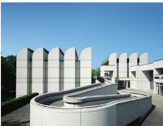
Das Bauhaus-Archiv / Museum für Gestaltung, Berlin, 2004