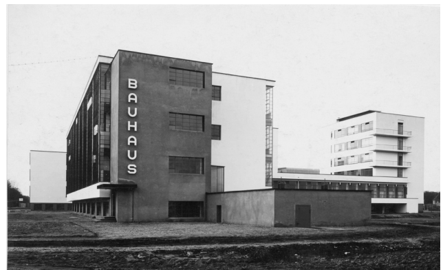
Lucia Moholy, Architekt: Walter Gropius, Bauhaus-Gebäude Dessau (1925-1926), 1927, Bauhaus-Archiv Berlin