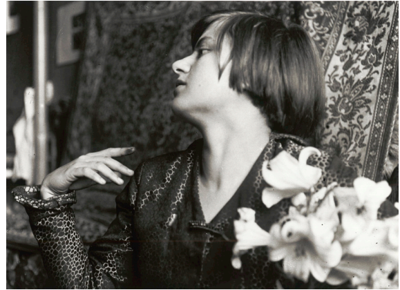
Marianne Brandt, Selbstporträt mit Lilien, um 1923, Bauhaus-Archiv Berlin