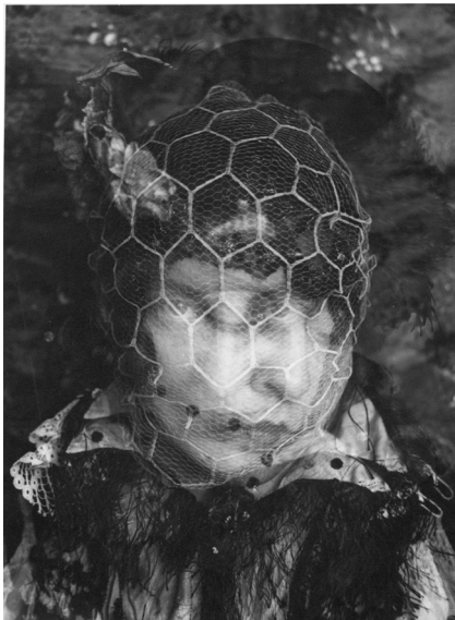
Gertrud Arndt, Maskenfoto Nr. 16, 1930, Bauhaus-Archiv Berlin © VG Bild-Kunst, Bonn 2026