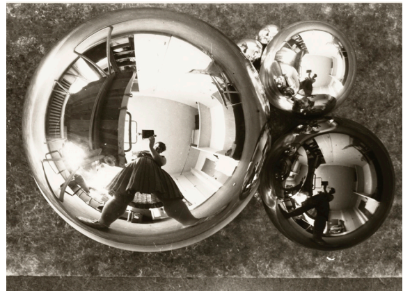
Marianne Brandt, Selbstporträt mit Kamera im Atelier in der Kugel gespiegelt, Bauhaus Dessau, um 1928 - 1929