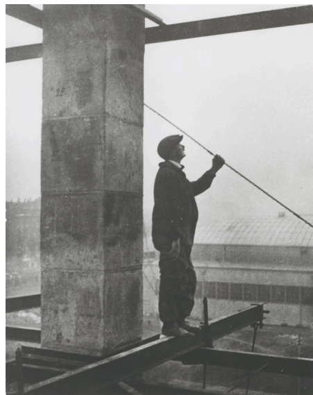
Ivana Meller-Tomljenović, Auf dem Bau, 1930, Bauhaus-Archiv Berlin © Marinko Sudac