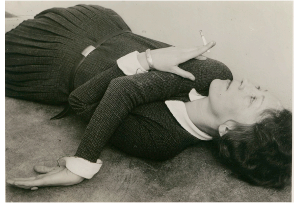
Grit Kallin-Fischer, Selbstporträt mit Zigarette, um 1928, Bauhaus-Archiv Berlin