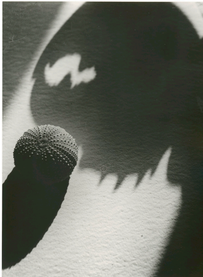
Lotte Collein, Seeigel und Schatten einer Krebsschere, 1928, Bauhaus-Archiv Berlin