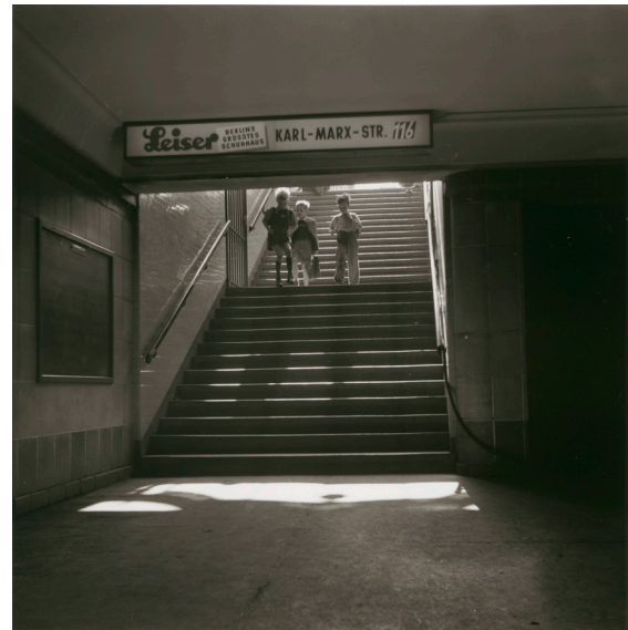
Elsa Thiemann, Berlin, Kinder am U-Bahneingang in Neukölln, 1950er-Jahre, Bauhaus-Archiv Berlin © Margot Schmidt