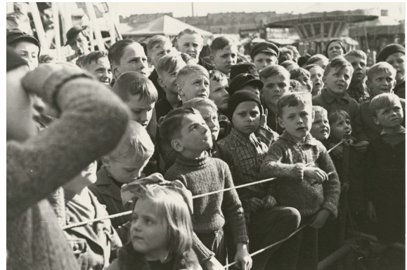
Marianne Brandt, Wartende Kinder, 1928, Bauhaus-Archiv Berlin © VG Bild-Kunst, Bonn 2026