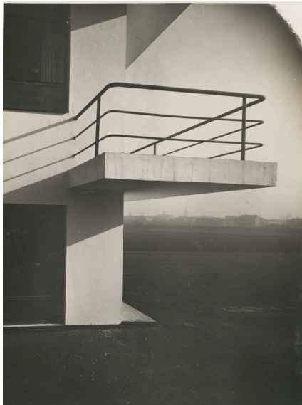
Lucia Moholy, Architekt: Walter Gropius, Bauhaus-Gebäude Dessau (1925-1926), Balkon am Ateliergebäude, 1926