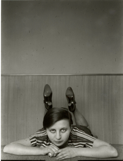
Gertrud Arndt, Selbstporträt im Atelier, Bauhaus Dessau, 1926, Bauhaus-Archiv Berlin © VG Bild-Kunst, Bonn 2026